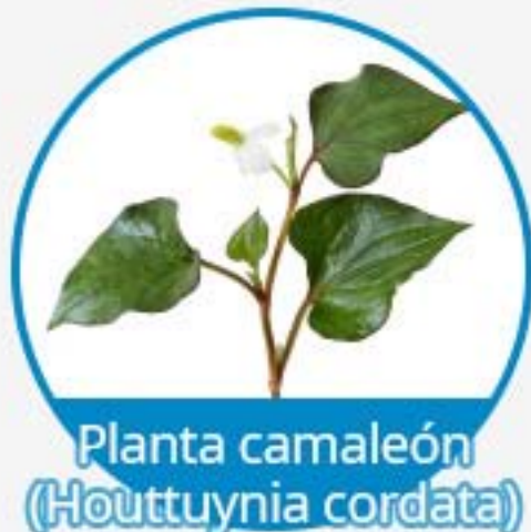
Planta camaleón ( Houttuynia cordata )